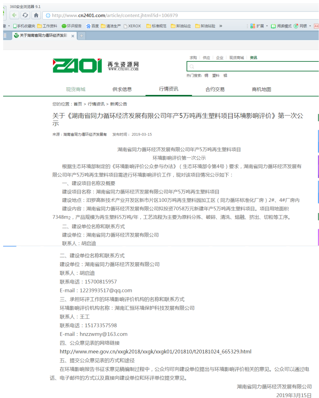
图1 2019年3月15日再生资源网公示截图