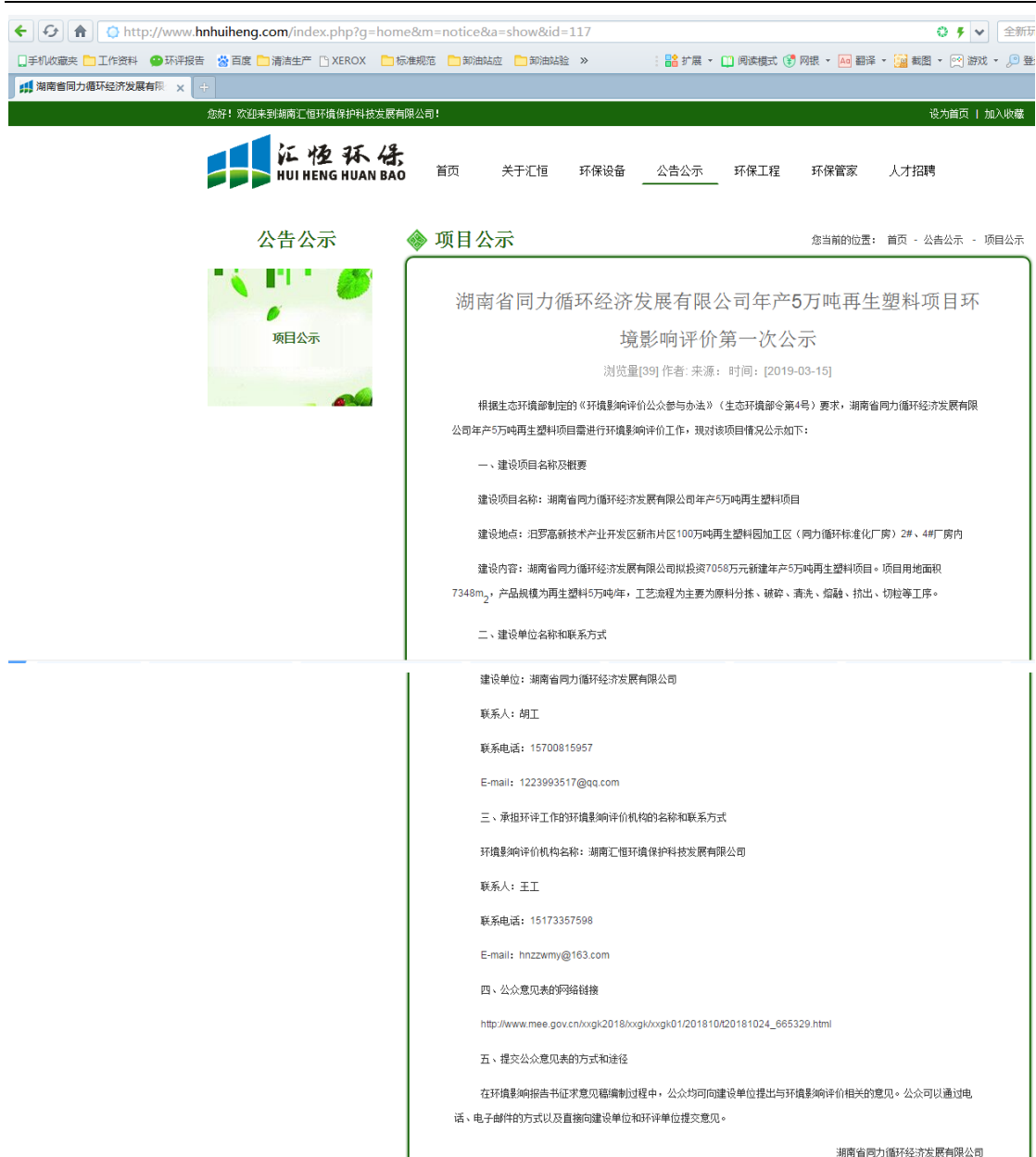
图2 2019年3月15日湖南汇恒环境保护科技发展有限公司网站公示截图