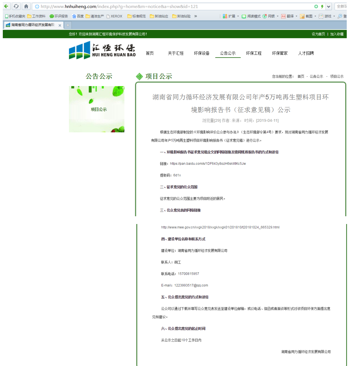
图 4 征求意见稿网络公示截图 2