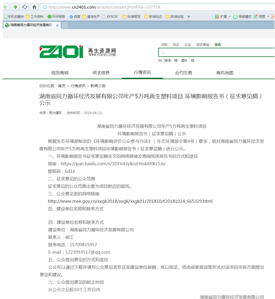
图3 征求意见稿网络公示截图 1