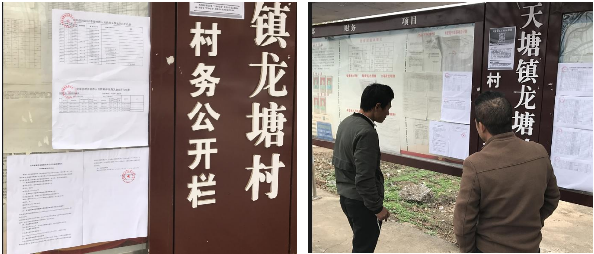
图2 第二次现场张贴公告公示