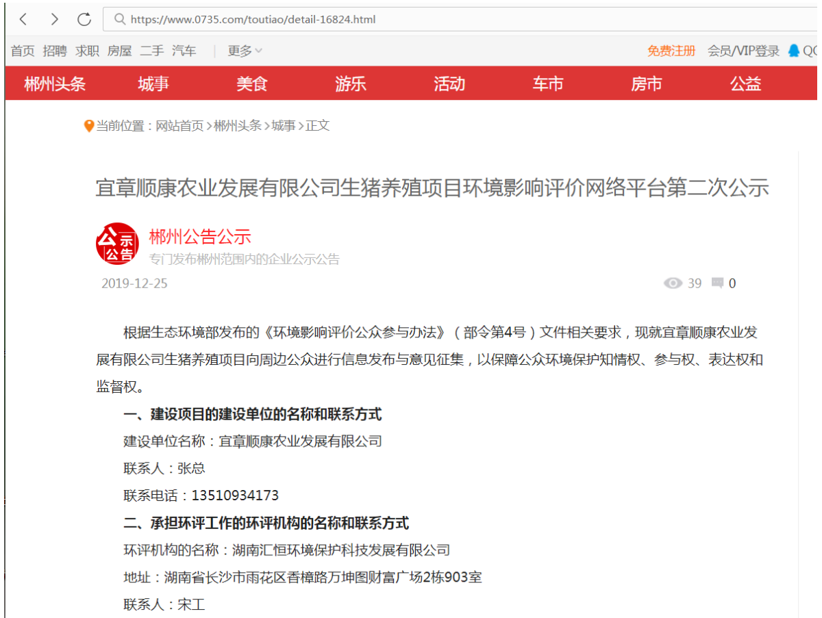
图3 第二次网络公示