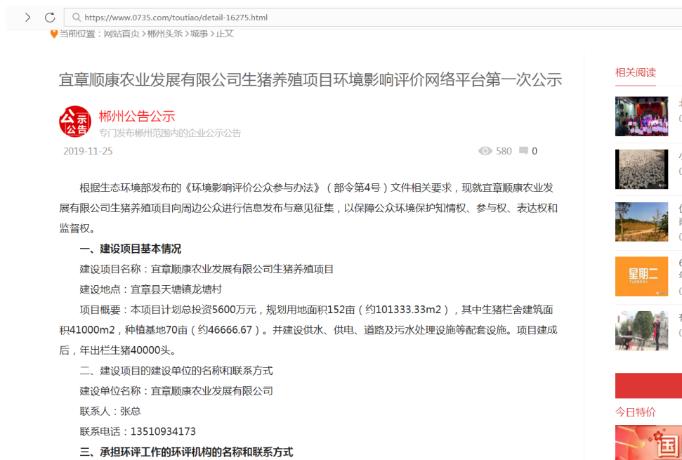
图 1 第一次网上公示截图

首次公示为网络平台公示的形式，在“郴州新闻网”（ https://www.0735.com/toutiao/detail-16275.html ）发布了本项目环境信息第一次公示，第一次网络平台公示见图 1。